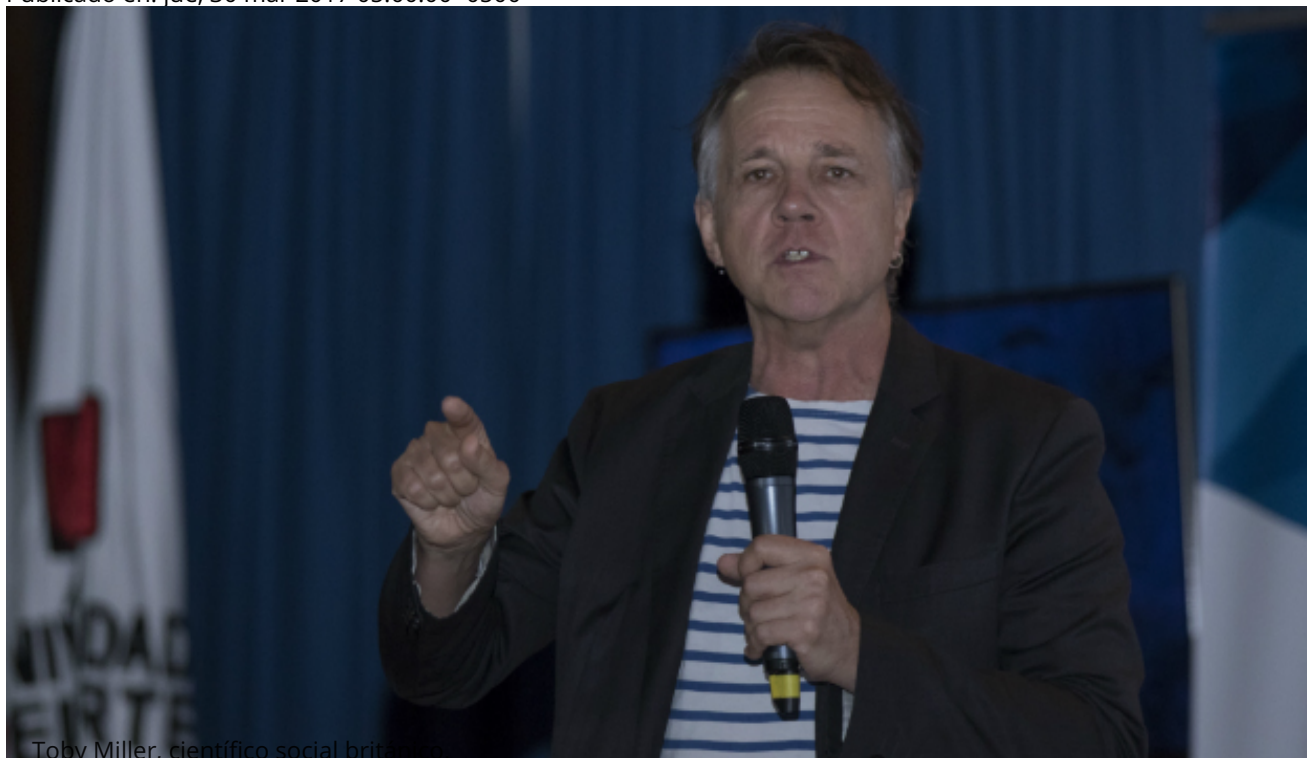
Toby Miller, científico social británico

Publicado en: jue, 30 mar 2017 05:00:00 -0500